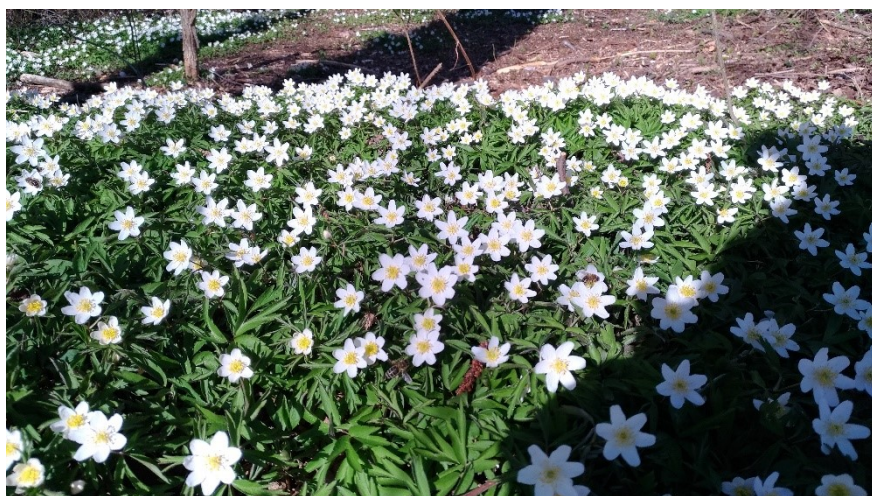
Jarní květy v Doudlebách nad Orlicí