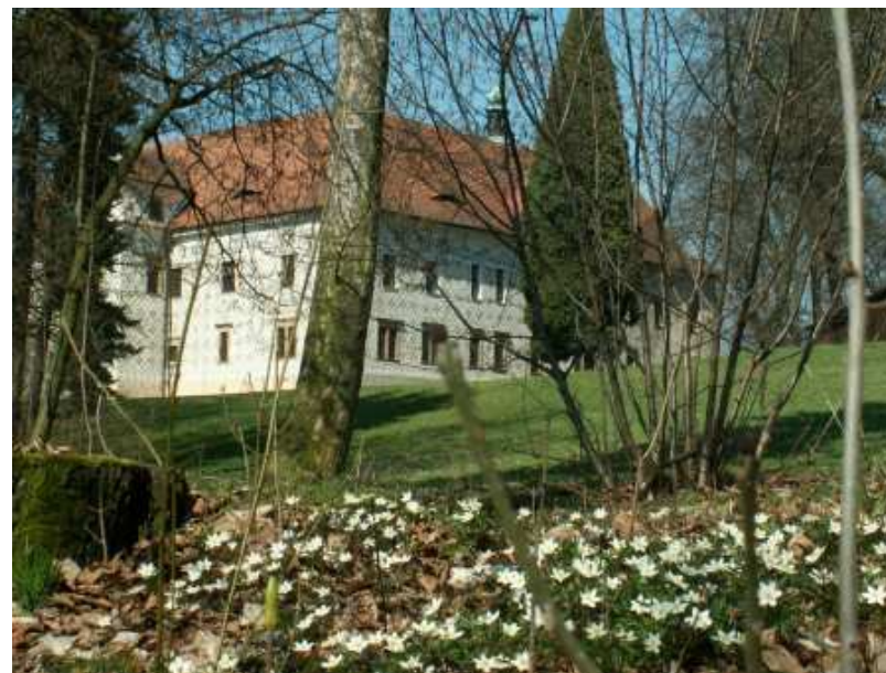
Co můžete mimo jiné spatřit v zámecké oboře:

Pořadatelé se těší na příjemný aktivně prožitý den a večer !!!