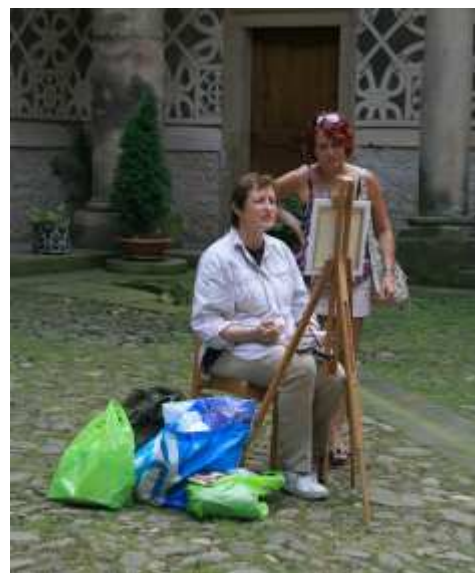
Doudlebský plenér - malíři při práci

DNE: 23. 8. 2011 OD: 8.00 hod DO: 14.00 hod